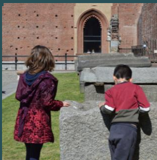
Castello Sforzesco e Museo degli strumenti musicali Pagina 4