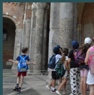
Percorsi in città Pagina 16