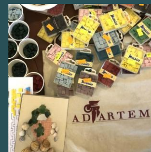
Laboratori in classe Pagina 18