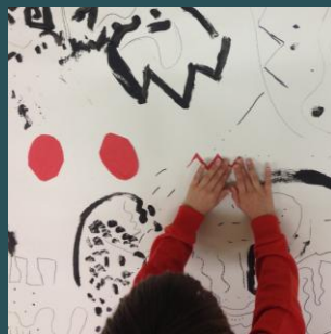
Museo del Novecento Pagina 9