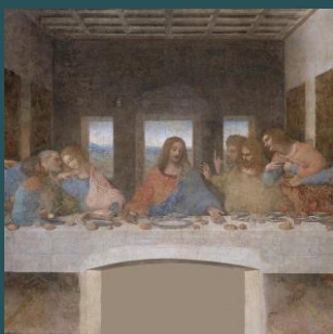
Cenacolo Vinciano Pagina 14