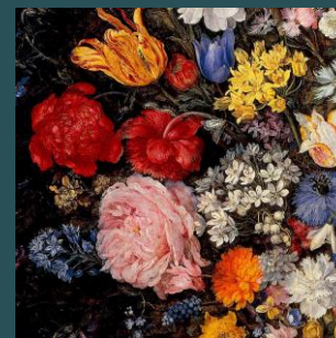
Pinacoteca Ambrosiana Pagina 12